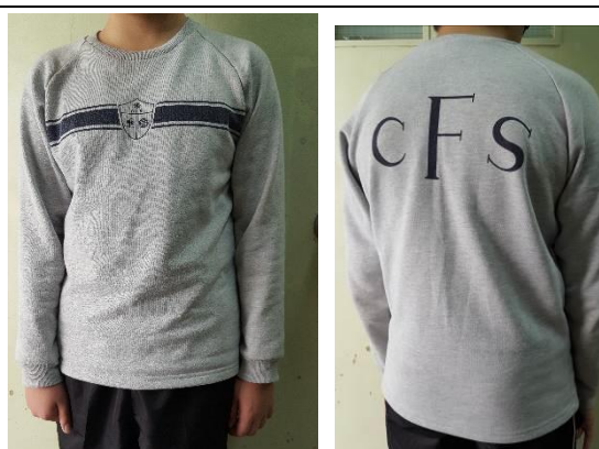
冬季長袖運動衫(藍社)