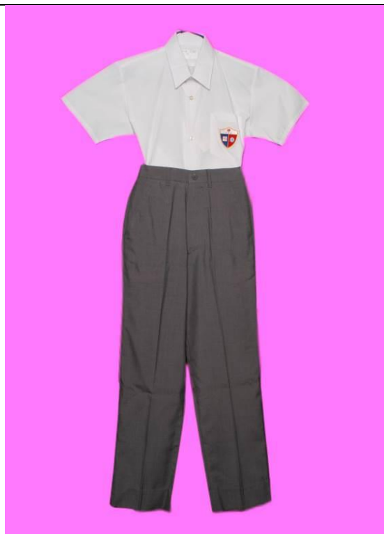
夏季男生白色的確涼短袖恤衫西褲連織校徽