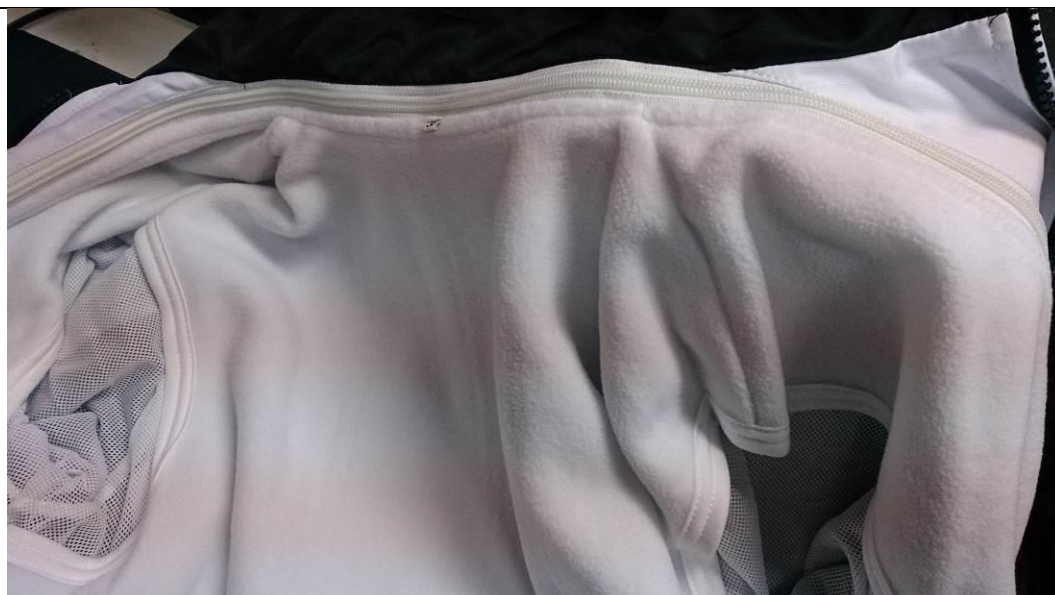
長袖運動外套背心內膽