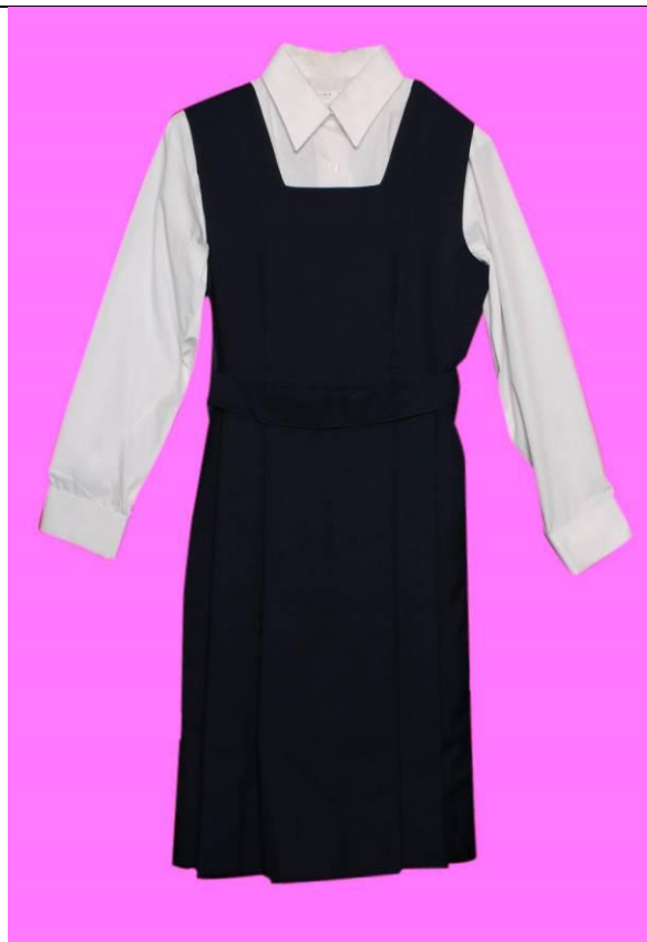
冬季女生藍色線絨背心裙