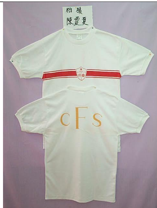
男女生四社白色針織短袖 T 恤連單色前後印花(紅及黃)，成分 100% Polyester 3M 吸濕排汗