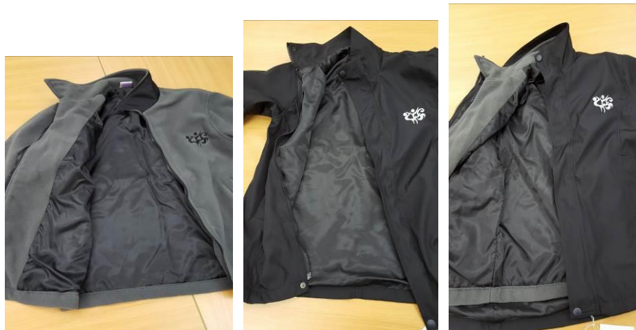
男女生校褸(高密特幼橫紋防水覆合布加防水 100%Polyester)連可拆長袖內膽(搖粒 380 克)，左前胸配有校徽