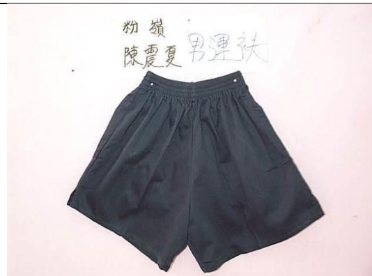
男生藍色斜紋運動短褲