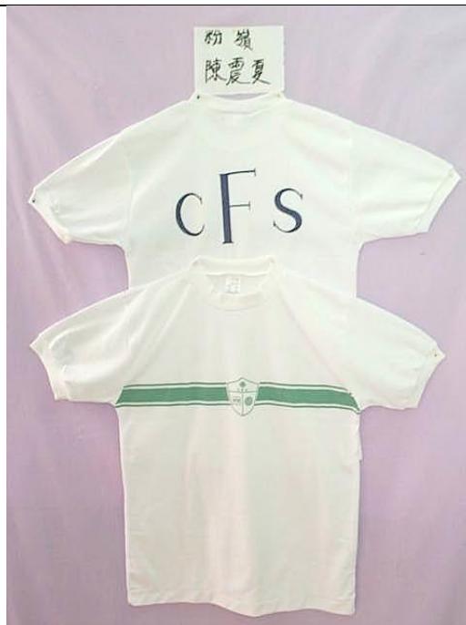
男女生四社白色針織短袖 T 恤連單色前後印花(藍及綠)