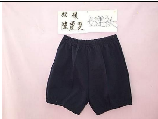
女生藍色原子短褲