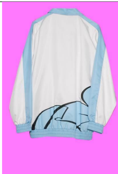
男女生水蜜桃布質長袖運動外套 (後)