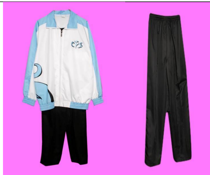
男女生水蜜桃布質長袖運動套裝 (前)