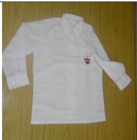
男女生白色的確涼長袖恤衫 (男生連織校徽)