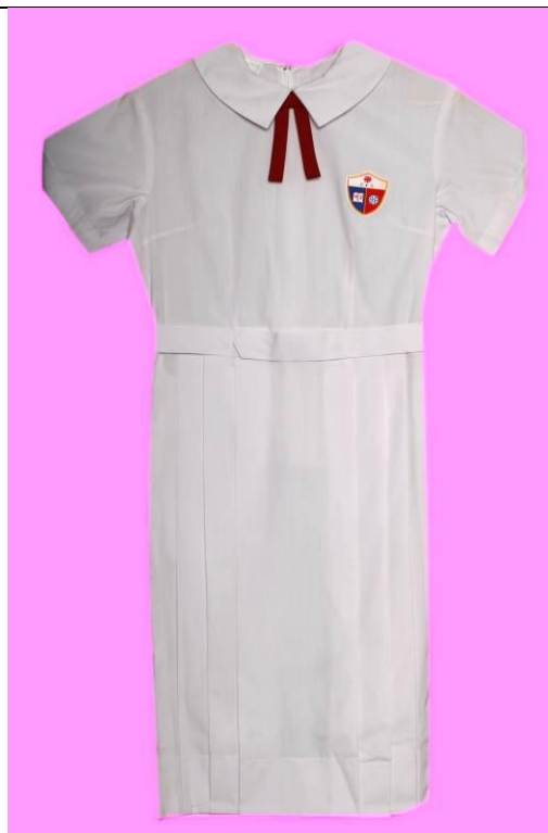
夏季女生白色的確涼連身裙連棗紅色領花及織校徽